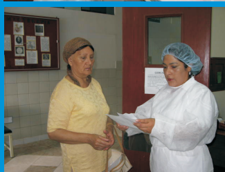
REVISIÓN DE RECETAS