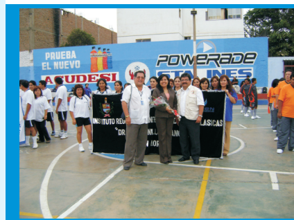
Representantes del IREN Norte, junto al Gerente Regional de Salud en el Campeonato de la GERESA La Libertad