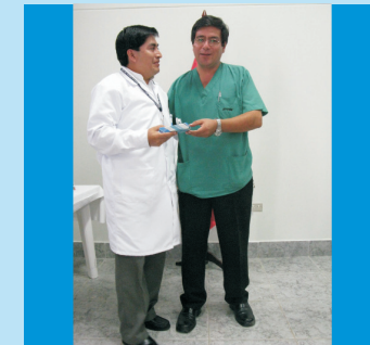
El Pdte. del CAFE IREN Norte, obsequia un presente a personal del Servicio de Farmacia