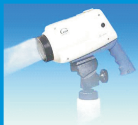
El SCREENING de Inspección Visual con Acido Acético (IVA/VAI) es un método alternativo al examen de Papanicolaou (PAP)