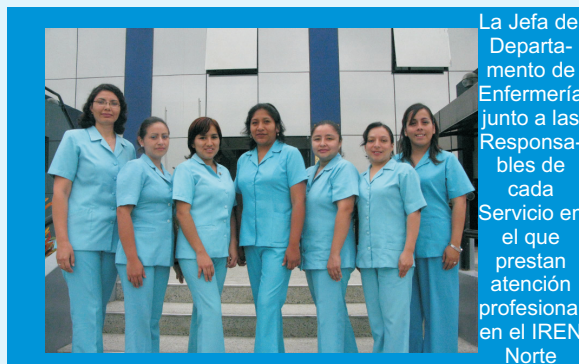
La Jefa del Departamento de Enfermería junto a las Responsables de cada Servicio en el que prestan atención profesional en el IREN Norte

El Departamento de Enfermería del IREN Norte, cuenta con profesionales especializados en Oncología quienes están capacitados para desempeñar una buena labor asistencial a los pacientes con cáncer. Las Enfermeras y Técnicos de Enfermería se encuentran prestando sus servicios asistenciales en las diferentes áreas de la Institución Oncológica: Servicio de Consultorios Externos y Triage, Servicio de Quimioterapia, Servicio de Hospitalización, Servicio de Centro Quirúrgico, Servicio de Tópico y Urgencias y Servicio de Procedimientos Especiales.