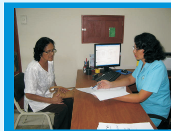
Orientación al paciente y familiares acerca de los cuidados que debe tener antes, durante y después de la quimioterapia

Se brinda atención especializada a los pacientes con cáncer en diferentes estadios, complementándose ello con consejerías y charlas tanto a pacientes como a familiares.