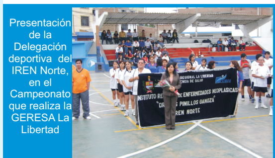
Presentación de la Delegación deportiva del IREN Norte, en el Campeonato que realiza la GERESA La Libertad