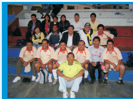
La barra del Personal de IREN Norte, acompañando al equipo de futbolito masculino durante el Campeonato de la GERESA La Libertad