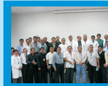
Muy felices todos los padres de familia de nuestra Institución con los obsequios que les fueron entregados por celebrarse el Día del Padre