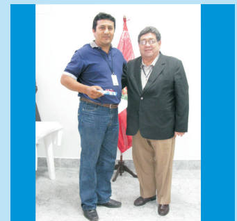
El Director de Planeamiento Estratégico entregando un obsequio a personal de mantenimiento del IREN Norte durante la celebración del Día del Padre.