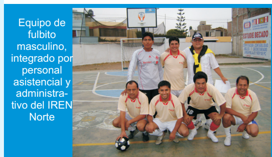
Equipo de futbolito masculino, integrado por personal asistencial y administrativo del IREN Norte