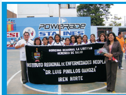
Delegación de personal del IREN Norte, durante su participación en el Campeonato organizado por la GERESA