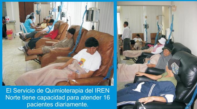
El Servicio de Quimioterapia del IREN Norte tiene capacidad para atender 16 pacientes diariamente.

El servicio de Quimioterapia ambulatoria tiene la capacidad de atender 16 pacientes por día, se aplican quimioterapias en infusión que varía de dos horas a 12 horas y quimioterapias en bolos, sub-cutáneas, intramusculares, orales. Asimismo se aplican estimulantes de colonias.