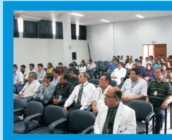
Los padres de familia de nuestra Institución presentes durante la Ceremonia dedicada a festejar esta significativa fecha por el Día del Padre