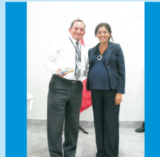
La Directora de Administración del IREN Norte, obsequiando un presente a personal administrativo de la Institución.