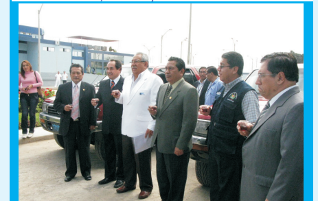
Brindis de honor por las dos unidades móviles con las que cuenta el Instituto Regional de Enfermedades Neoplásicas “Dr. Luis Pinillos Ganoza” - IREN Norte