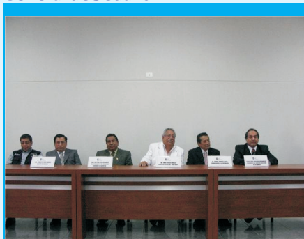
Autoridades de la Región La Libertad, durante la Conferencia de Prensa por la entrega de unidades móviles al

Asimismo, hizo su intervención el Vicepresidente Regional de La Libertad, quien mencionó que el IREN Norte es un modelo a seguir por otras Instituciones de salud, ya que está creciendo por la buena gestión realizada actualmente. Así también el Superintendente de la SUNASS durante su participación mencionó el