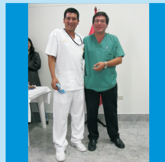
El Presidente del CAFE IREN Norte entrega un obsequio a personal Técnico de Enfermería por el Día del Padre.