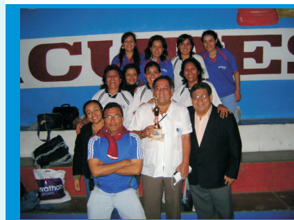
Equipo Femenino de Futbolito Ganadoras del Relámpago durante la primera fecha del Campeonato de la GERESA La Libertad