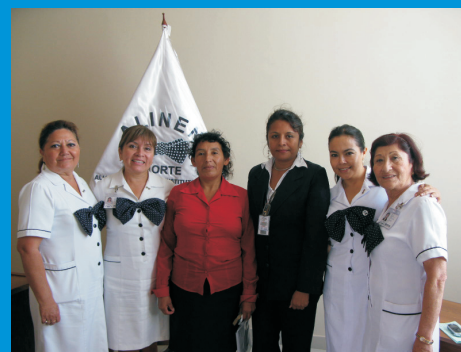
El Servicio Social del Instituto Regional de Enfermedades Neoplásicas “Dr. Luis Pinillos Ganoza” - IREN Norte, apoya al paciente con cáncer asistiéndolo con orientación y/o canalizando ayuda social para su tratamiento.

importante que valoren, utilicen sus fortalezas y dinamicen las ayudas mutuas que pudieran encontrar en su entorno.