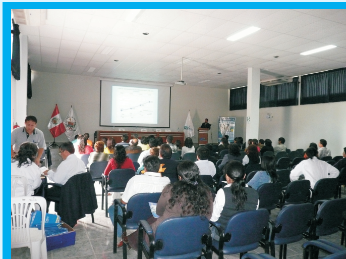
Masiva concurrencia de los profesionales de la salud de las diferentes áreas de trabajo multidisciplinario, asistentes al Curso-Taller Manejo del Cáncer, Responsabilidad Multidisciplinaria.

El evento contó con la participación de más de 200 profesionales de la salud, que se dieron cita en las instalaciones del IREN Norte para el desarrollo de los temas programados para dicho Curso - Taller.