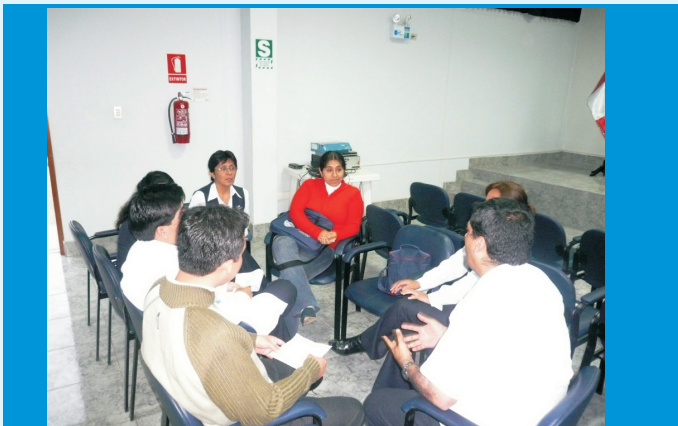
El Clima laboral en una Institución es importante porque depende de la interacción entre los trabajadores para el buen cumplimiento de sus funciones