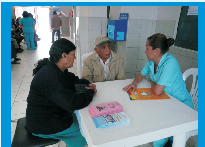
Con la implementación del Seguro Integral de Salud (SIS) en el Instituto Regional de Enfermedades Neoplásicas "Dr. Luis Pinillos Ganoza" - IREN Norte, las personas de bajos recursos económicos se beneficiarán con la atención a través de este seguro de salud.