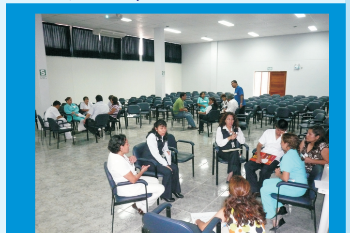
Los trabajadores administrativos y asistenciales participaron del Curso - Taller. En la foto se encuentran formados en grupos para compartir experiencias durante las sesiones programadas en los talleres.

El desarrollo del Curso – Taller permitió que los participantes tengan un mayor conocimiento de la importancia de la calidad de vida, puedan reconocer y manejar satisfactoriamente los momentos críticos en la interacción diaria en el ambiente laboral, así mismo facilitar la identificación de las necesidades de los usuarios en las diferentes áreas y servicios, también permitió mejorar su capacidad de autoconfianza y seguridad en sí mismos y ampliar el clima de confianza con los compañeros de trabajo, y finalmente resaltar la importancia del contacto físico y visual como modo de expresión y regulación de emociones brindando seguridad, protección, confianza, fortaleza y sanación.