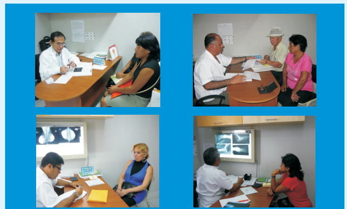
La población beneficiaria del SIS tendrá acceso a la atención con nuestros médicos especialistas de las diferentes patologías de cáncer.

El Instituto Regional de Enfermedades Neoplásicas - IREN Norte es un establecimiento de salud de la red de servicios del Ministerio de Salud (MINSA), actualmente categorizado como Instituto Especializado III-2, mediante Resolución Gerencial N° 0583-2009 GRLL-GGR/GS, de fecha 25 de Junio del 2009, correspondiente al 8° Nivel de Complejidad del Tercer Nivel de Atención, de referencia regional y de alta complejidad; atiende a pacientes pagantes y pronto estará brindando atención a beneficiarios del SIS, convirtiéndose de esta manera en el pionero en la atención oncológica a beneficiarios del SIS a nivel de la Macro Región Nor Oriente del país.