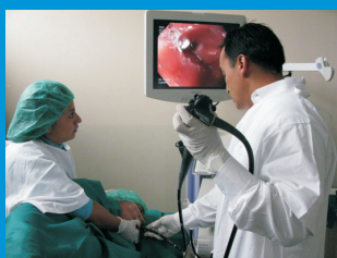
La población tendrá más acceso a la atención oncológica a través de la implementación del Sistema Integral de Salud (SIS) en el Instituto Regional de Enfermedades Neoplásicas "Dr. Luis Pinillos Ganoza" - IREN Norte