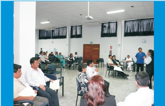
Taller de Crear Sonrisas, realizado por la Unidad de Gestión de la Calidad del IREN Norte, dirigido al personal de la Institución Oncológica, con la finalidad de fortalecer la interacción entre compañeros de trabajo y su público usuario