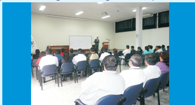
Personal del IREN Norte es capacitado a través de un Taller de Relaciones Humanas, con la finalidad de tener un Clima Laboral armonioso en la Institución.

productividad, calidad, servicio, identificación y desarrollo pleno de sus miembros y en contraparte si es negativa ocasiona situaciones de conflicto y de bajo rendimiento.