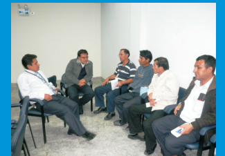
Los trabajadores del IREN Norte durante el Curso-Taller de Relaciones Humanas, desarrollado en cuatro sesiones, con el objetivo de sensibilizarlos respecto a temas de interacción personal.

Hay que entender que en la administración pública, si bien los ingresos que perciben los servidores por concepto de su trabajo diario no son rigurosamente los más altos -Remuneración Mínima Vital-, considerando el desempeño que realizan; empero las personas no solo se motivan con sueldos necesariamente, si bien es importante, muchos van a producir mejor si es que se les respeta, si hay un reconocimiento a su labor y si se le otorga mayores responsabilidades, además de sentirse escuchado en todas las direcciones; es decir se debe crear un buen entorno de trabajo, toda vez que un mal clima laboral se origina además de los bajos sueldos, aunado a la crisis psicológica que el sistema financiero crea a través de la globalización y la incertidumbre por el puesto de trabajo, por circunstancias de mala comunicación entre los servidores, que generan malos entendidos (chismes) que van mellando el buen clima laboral.