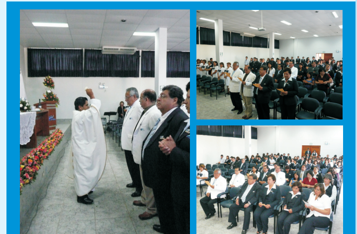
Momentos de reflexión, durante la Misa de Acción de Gracias por el II Aniversario del IREN Norte, en donde se contó con la asistencia de todo el personal de nuestra Institución.

Del mismo modo, en honor a esta importante fecha para el IREN Norte, se realizó una Misa de Acción de Gracias en el Auditorio Institucional, el jueves 10 de Diciembre del 2009, con la asistencia de autoridades regionales, trabajadores de la Institución e invitados.