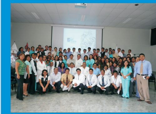
Personal del IREN Norte, participando de la Chocolatada Navideña, el miércoles 23 de Diciembre del 2009, en el Auditorio Institucional.