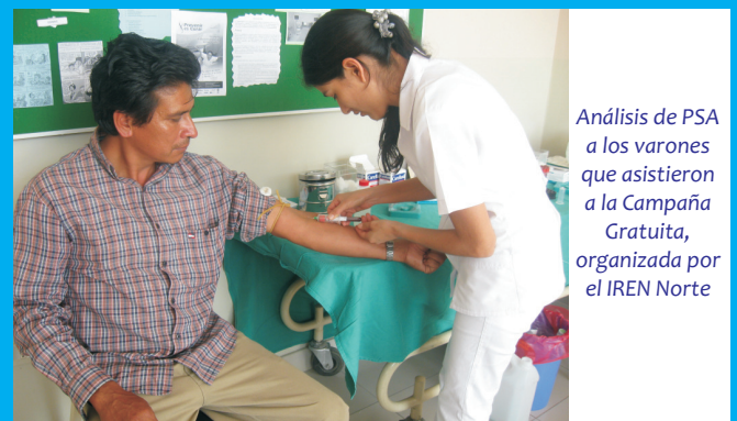
Análisis de PSA a los varones que asistieron a la Campaña Gratuita, organizada por el IREN Norte

Asimismo, se brindaron consejerías a cargo de personal especializado de enfermería y nutrición, quienes informaron a los asistentes acerca de las medidas en cuanto a estilos de vida y dietas saludables, fortaleciendo los conocimientos de los pacientes, con la finalidad de que pongan en práctica las recomendaciones brindadas y contribuyan a la difusión de las medidas preventivas entre sus familiares y amigos.