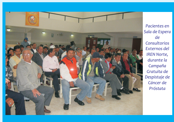
Pacientes en Sala de Espera de Consultorios Externos del IREN Norte, durante la Campaña Gratuita de Despistaje de Cáncer de Próstata