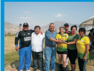
Personal del departamento de Enfermería del IREN Norte, ganadoras del Torneo de Vóley por el Aniversario de la Institución Oncológica.

Dentro del marco celebratorio deportivo, se organizó una Ginkana de Confraternidad, en donde participaron trabajadores asistentes, quienes estuvieron motivados al realizar cada uno de los juegos programados en esta actividad.