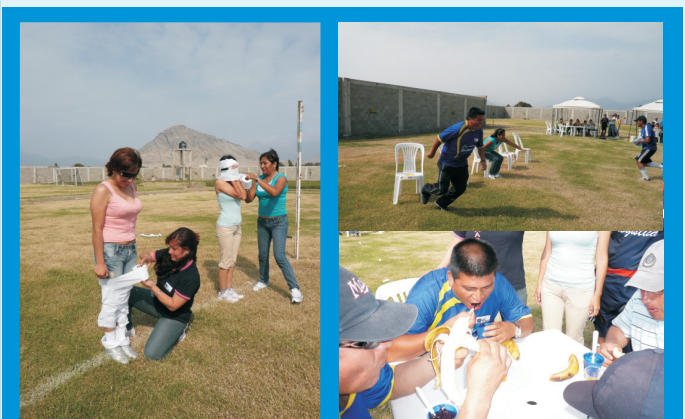
Personal del IREN Norte, participando de la Ginkana, durante la mañana deportiva, en el marco de la celebración del II Aniversario del IREN Norte

Dentro del marco celebratorio deportivo, se organizó una Ginkana de Confraternidad, en donde participaron trabajadores asistentes, quienes estuvieron motivados al realizar cada uno de los juegos programados en esta actividad.