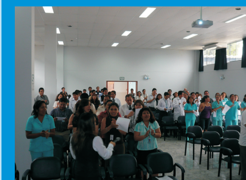
El personal del IREN Norte, entonando Villancicos durante la Chocolatada Navideña, organizada por el IREN Norte, en el Auditorio Institucional.