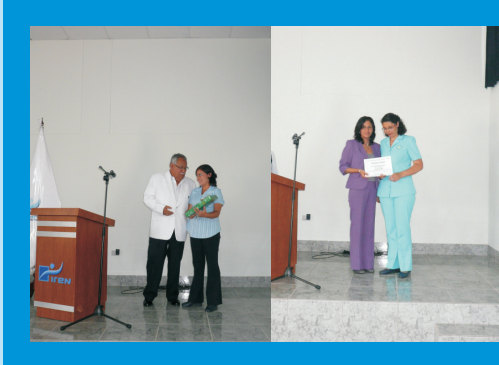
Premiación a los Ganadores del Concurso de Ambientes Navideños del IREN Norte. 1er. Puesto: Servicio de Procedimientos Diagnósticos; 2do. Puesto: Servicio de Quimioterapia