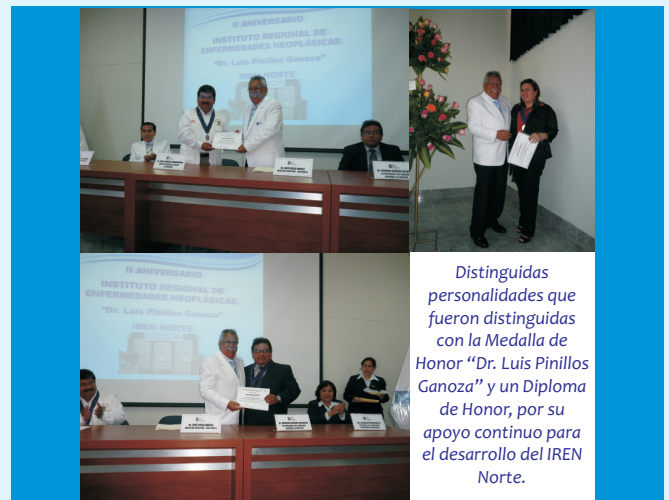
Distinguidas personalidades que fueron distinguidas con la Medalla de Honor “Dr. Luis Pinillos Ganoza” y un Diploma de Honor, por su apoyo continuo para el desarrollo del IREN Norte.