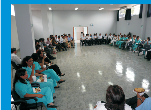
Compartir Navideño entre todos los trabajadores del IREN Norte.