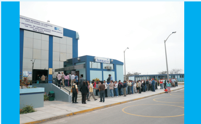
Masiva concurrencia de varones mayores de 40 años, durante la Campaña Gratuita de Despistaje de Cáncer de Próstata, organizada por el IREN Norte en el marco de la celebración de su II Aniversario Institucional.

El Instituto Regional de Enfermedades Neoplásicas “Dr. Luis Pinillos Ganoza” – IREN Norte, entidad encargada de brindar servicios oncológicos en la Región Nor Oriente del país, realizó Campaña Gratuita de Despistaje de Cáncer de Próstata a más de 300 varones de la ciudad de Trujillo y distritos.