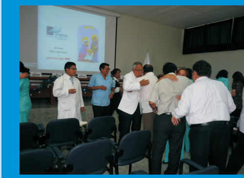
Abrazo Navideño entre todo el personal del IREN Norte, en estas fechas de unión y confraternidad.