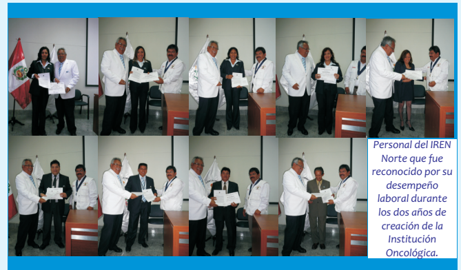
Personal del IREN Norte que fue reconocido por su desempeño laboral durante los dos años de creación de la Institución Oncológica.