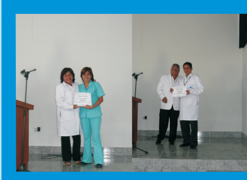
Premiación al 2do. Puesto: Centro Quirúrgico, y el Tercer Puesto: Servicio de Farmacia