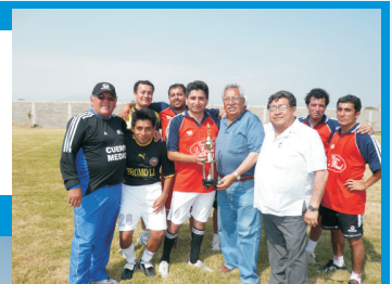
Los representantes de la Dirección Ejecutiva de Salud Ambiental - DESA, fueron los ganadores del Torneo de Fútbol del IREN Norte

Se jugaron los partidos de fútbol, quedando como campeones del Torneo de Confraternidad, los representantes de la DESA. Así también las ganadoras del Campeonato de Voley Femenino fueron las integrantes del equipo del Departamento de Enfermería del Iren Norte.