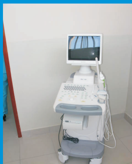
Todas las entidades públicas son titulares de bienes muebles y bienes inmuebles, la regla es que sean propietarias del patrimonio que asumen en administración directa