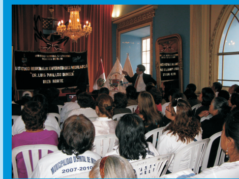
Se realizó la Conferencia Magistral "Dieta y Cáncer" por la Semana Perú contra el Cáncer, a la cual asistieron más de un centenar de personas