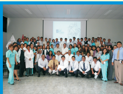
Personal del IREN Norte, participando en la celebración de Navidad en diciembre del 2009, en el Auditorio Institucional.