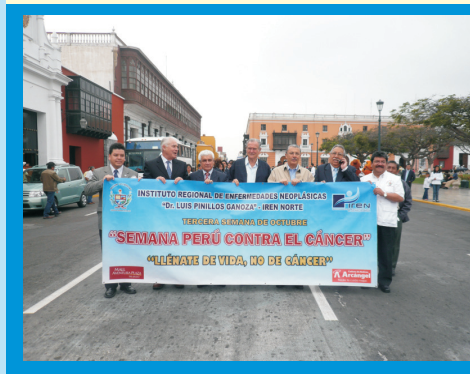
En octubre del 2009, realizamos el Pasacalle por la Semana Perú Contra el Cáncer, con la asistencia de autoridades: Vice Ministro de Salud, Pdte. del Gobierno Regional La Libertad, Gerente Regional de Salud, Jefe Institucional del IREN, Pdte. de la Coalición Multisectorial Perú contra el Cáncer y Director Ejecutivo del IREN Norte, además de instituciones públicas y privadas