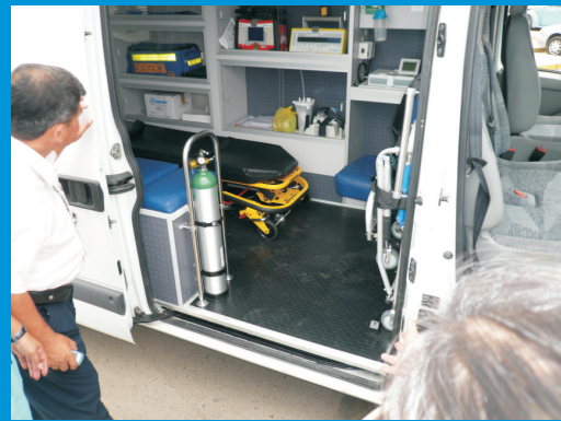
El control patrimonial constituye una función de las Administraciones Públicas, la misma que se conforma por un conjunto de normas y reglamentos

Todas las entidades públicas son titulares de bienes muebles y bienes inmuebles, la regla es que sean propietarias del patrimonio que asumen en administración directa. Pero, en algunas ocasiones, ocurre que muchas entidades tienen bajo su administración y cautela determinados bienes que son propiedad de otras entidades públicas, y que los poseen debido a la suscripción de convenios de cooperación interinstitucional, como datos, cesiones de unos temporales o por disposición de alguna norma especial. El caso es que también estas mismas entidades pueden tener bajo su uso y administración otro tipo de bienes de particulares, otorgados para su utilización institucional o por tiempo determinado, como es el caso de los bienes incautados, los