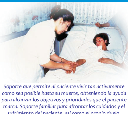
Soporte que permite al paciente vivir tan activamente como sea posible hasta su muerte, obteniendo la ayuda para alcanzar los objetivos y prioridades que el paciente marca. Soporte familiar para afrontar los cuidados y el sufrimiento del paciente, así como el propio duelo.

sufrimiento al moribundo, bien a través de medios preventivos curativos o rehabilitadores, e incluso de terapias intervencionistas, por lo que definirlos de cómo solo tratamiento de soporte es una simplificación excesiva de un trabajo más complejo. Importante mencionar que los cuidados paliativos no solo consideran a la etapa final para aliviar las molestias físicas y otras, sino para eliminar la ruptura emocional y procurar la realización personal y otras necesidades.