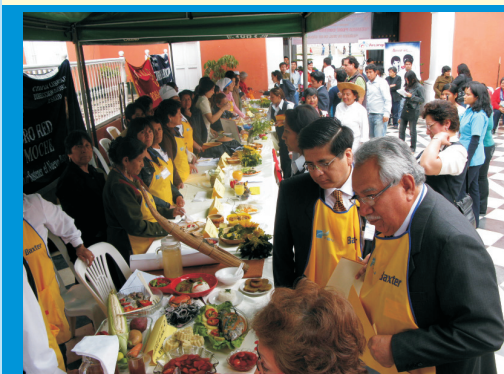
Concurso de Platos Típicos Saludables , en el que participaron agentes comunitarios de salud, clubes de madres y avales liberteños, con la finalidad de realizar alimentos saludables para prevenir el cáncer