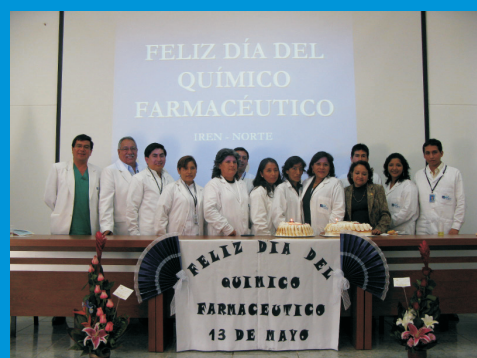
En mayo del 2009, en las instalaciones del IREN Norte, se brindó un homenaje a los profesionales de la salud Químicos Farmacéuticos, en su día