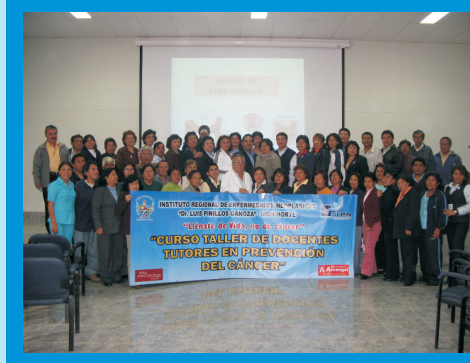
Capacitación a Docentes de las diferentes Instituciones Educativas de Trujillo , quienes asumieron el compromiso de trabajar por la educación de las medidas preventivas del cáncer.