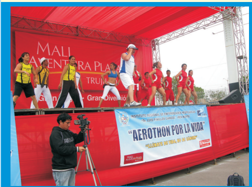
II Aerathon por la Vida , realizada por la Semana Perú contra el Cáncer en el Mall Aventura Plaza, en la que participaron niños, adolescentes adultos y personas de la tercera edad