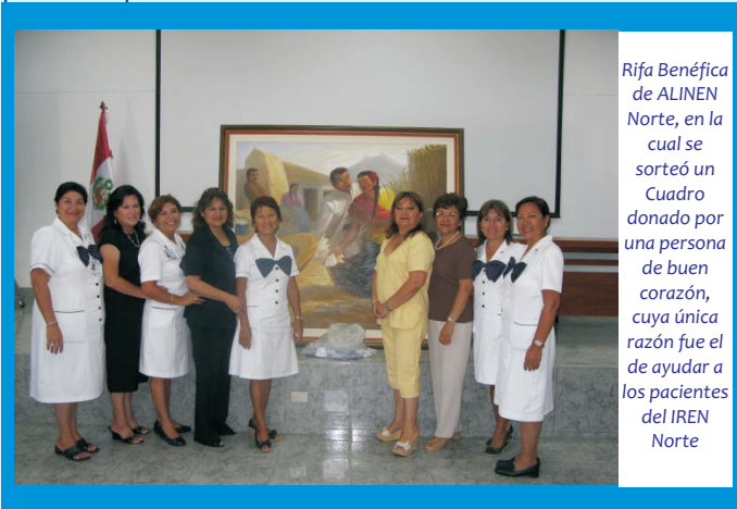
Rifa Benéfica de ALINEN Norte, en la cual se sorteó un Cuadro donado por una persona de buen corazón, cuya única razón fue el de ayudar a los pacientes del IREN Norte

Así también, organizaron una Noche de Peña Femenina, en la cual participaron más de un centenar de damas que apoyaron esta causa tan noble que es la de ayudar a un paciente que lo necesita.