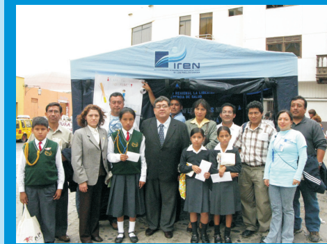
El IREN Norte organizó el Concurso de Dibujo y Pintura, dirigido a alumnos de Nivel Primario de Colegios de Trujillo y distritos, para promocionar el evitar el consumo de tabaco en los niños y adolescentes