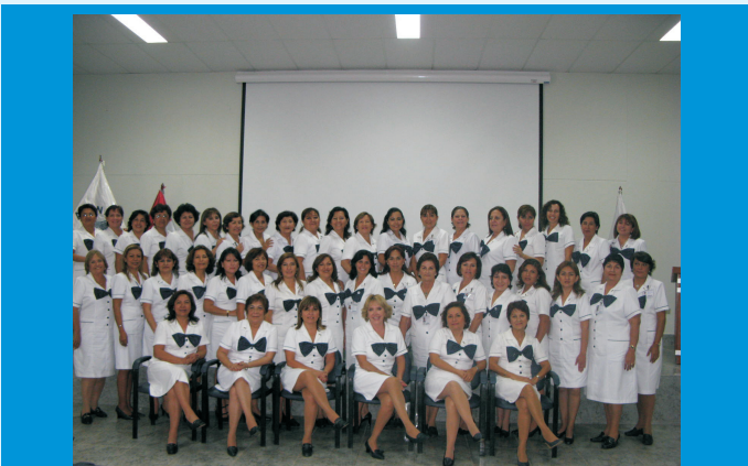
Las Damas Voluntarias de ALINEN NORTE, brindan apoyo a todos los pacientes de escasos recursos económicos del IREN Norte. Asimismo, los apoyan emocionalmente ante los problemas adversos que enfrentan los pacientes con cáncer.

La Alianza de Apoyo al Instituto Regional de Enfermedades Neoplásicas - ALINEN NORTE, Asociación integrada por Damas Voluntarias que trabajan desinteresadamente en beneficio de los pacientes con cáncer de escasos recursos económicos, durante el año 2009 realizaron diversas actividades benéficas para recaudar fondos económicos para prestar ayuda a los pacientes que lo necesitan.