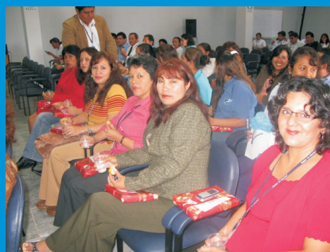
Homenaje a todas las madres del IREN Norte, por el Día de la Madre, en mayo del 2009.