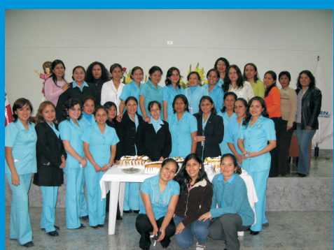
Día de la Enfermera en agosto del 2009. Se realizó un homenaje a todas las enfermeras del IREN Norte.