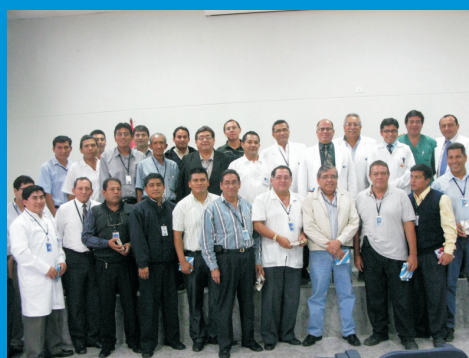
Celebración por el Día del Padre, en Junio del 2009. Todos los padres del IREN norte, recibieron un homenaje especial.