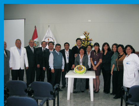
En septiembre del 2009, se celebró el Día del Contador Público, homenajeando a los compañeros de trabajo que ejercen esta profesión.