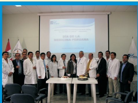
Día de la Medicina Peruana, en octubre del 2009, se les rindió un homenaje especial a todos los médicos de nuestra institución