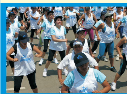
I AEROTHON POR LA VIDA , en Febrero del 2009, por el Día Mundial contra el Cáncer, para promover la actividad física, en donde participaron más de 500 personas.