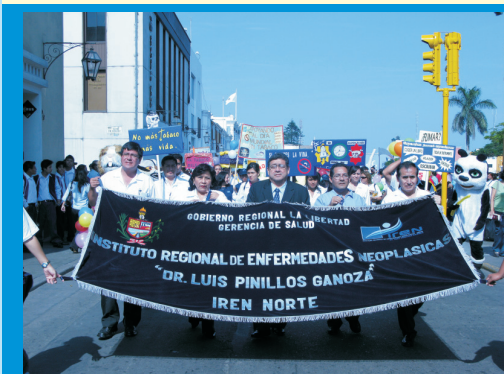
Pasacalle por el Día Mundial sin Tabaco , en donde participaron diferentes instituciones públicas y privadas con el objetivo de concientizar a la población a evitar el consumo de tabaco