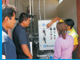
El Control Patrimonial supone también la administración de un conjunto de procedimientos, técnicas y criterios de gestión, cuya dinámica se inicia desde la adquisición de los mismos.