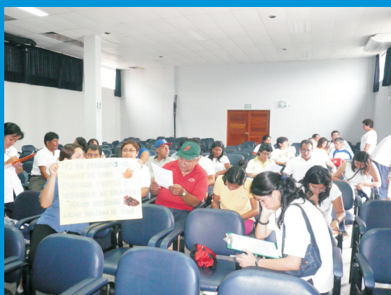
Durante la “Caminata por la Vida” se aplicó una encuesta a los participantes acerca de la actividad física.