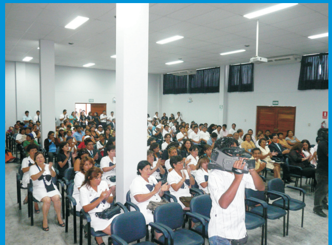
Público asistente a la Conferencia Magistral: "Avances del Plan Nacional del Control del Cáncer" organizado por el Día Mundial Contra el Cáncer en el Auditorio del IREN Norte

instalaciones de nuestra Institución para tan magno evento.