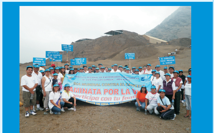
Participantes de la Caminata por la Vida llegaron a la meta: las huacas del Sol y la Luna, dando cumplimiento a una de las actividades del Día Mundial Contra el Cáncer, programadas por el IREN Norte