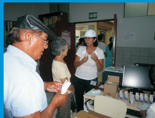
Los representantes de Laboratorios GlaxoSmithKline Perú S.A. donaron protectores solares a todos los pacientes atendidos durante la Campaña de Salud, organizada por el IREN Norte

El IREN Norte consciente de las dificultades económicas que la población presenta actualmente, realizó dichos exámenes gratuitamente, con el afán de ayudar a que la población pueda prevenir el cáncer, considerando que la prevención es la única arma para combatir esta enfermedad.