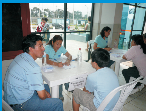
Personal de Enfermería del IREN Norte, brindando consejería preventiva a los asistentes a la Campaña de Salud del IREN Norte, organizada por el Día Mundial Contra el Cáncer

Asimismo, se brindaron consejerías preventivas a cargo de personal especializado de enfermería, nutrición y psicología, quienes informaron a los asistentes acerca de las medidas de prevención en cuanto a estilos de vida saludables, fortaleciendo los conocimientos de los pacientes, con la finalidad de que pongan en práctica las recomendaciones brindadas y contribuyan a la difusión de las medidas preventivas de dicha enfermedad entre sus familiares y amigos.