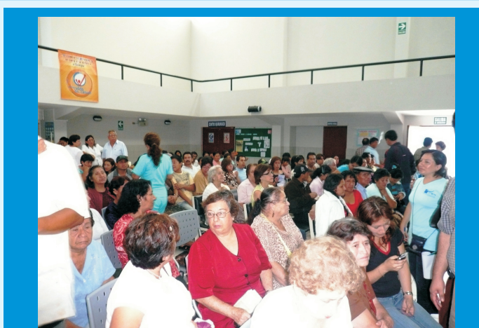
Público asistente a la Campaña Gratuita de Despistaje de Cáncer de Piel en las instalaciones del IREN Norte.

El Instituto Regional de Enfermedades Neoplásicas “Dr. Luis Pinillos Ganoza” – IREN Norte, entidad encargada de brindar servicios oncológicos a la Macro Región Nor Oriente del país, en el marco de la celebración del Día Mundial Contra el cáncer, realizó la Campaña Gratuita de Despistaje de Cáncer de piel a más de 200 personas de la Región La Libertad.