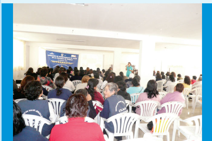
Charla Educativa a la Asociación de Promotores de Salud de la Provincia de Trujillo, realizada en el distrito El Porvenir

IREN NORTE realizó Charla Educativa de Estilos de Vida Saludables a la Asociación de Promotores de Salud de la Provincia de Trujillo por realizarse el Día del Agente Comunitario de Salud