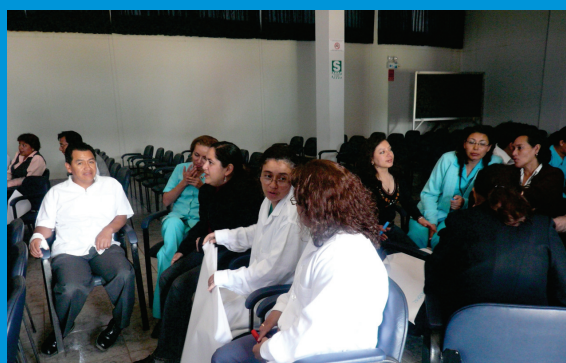
El personal de la institución oncológica formando grupos de trabajo para resolver las preguntas planteadas durante la charla de sensibilización de clima organizacional