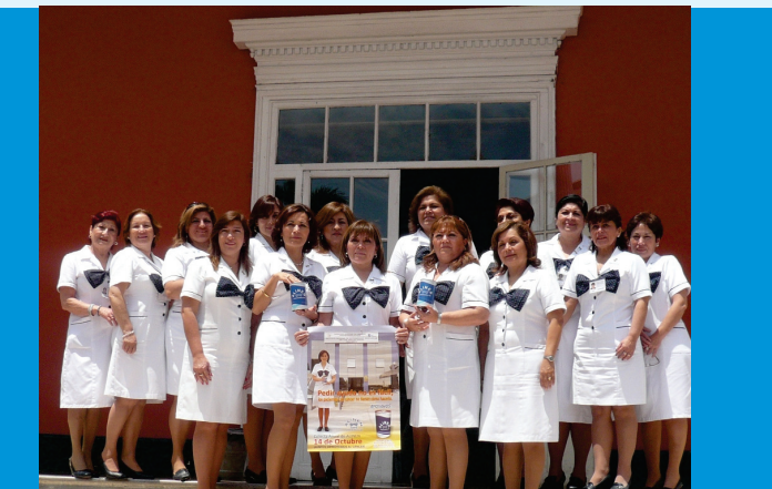
Voluntarias de ALINEN NORTE, trabajando juntas por un mismo fin: recolectar dinero para brindar apoyo a los pacientes con cáncer de escasos recursos económicos

Las damas voluntarias de ALINEN NORTE, brindan cuidado y atención con calidad y calidez a los pacientes de IREN Norte, apoyándolos y motivándolos día tras día con el transcurrir de su enfermedad.