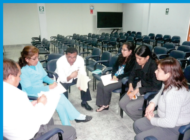
Los jefes y responsables de las diferentes áreas administrativas del IREN Norte, participando activamente del taller.