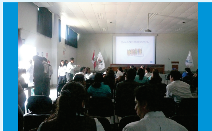
Todo el personal que labora en el IREN Norte participando del estudio de clima organizacional de la institución oncológica

El Instituto Regional de Enfermedades Neoplásicas “Dr. Luis Pinillos Ganoza” – IREN Norte, efectuó el estudio de Clima Organizacional a sus trabajadores a través de la Empresa Business Model Corporation S.A.C., quienes realizaron el estudio durante 04 días, (23, 24, 25 y 29/11/10) con el objetivo de informar la percepción de la cultura organizacional, potencial humano y diseño organizacional que tiene el personal, lo que beneficiará el desempeño y desarrollo de sus funciones y por ende el cumplimiento de las metas de la institución.