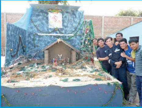
Trabajadores del área de mantenimiento orgullosos muestran su nacimiento