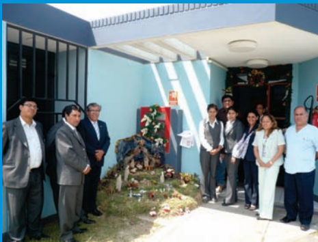
El personal del módulo administrativo I mostrando el nacimiento que construyeron para el concurso de ambientes navideños