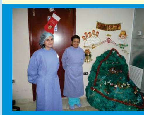
El servicio de Quimioterapia, también participó del concurso de ambientes navideños