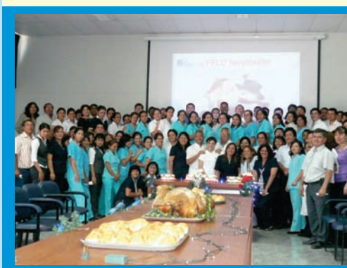
Personal que labora en el IREN Norte, degustando de la chocolatada que se realizó el 23 de Diciembre del 2010 por fiestas navideñas