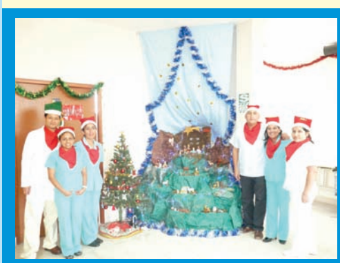
El tercer lugar en el concurso de ambientes navideños fue para el servicio de tóxico y urgencias