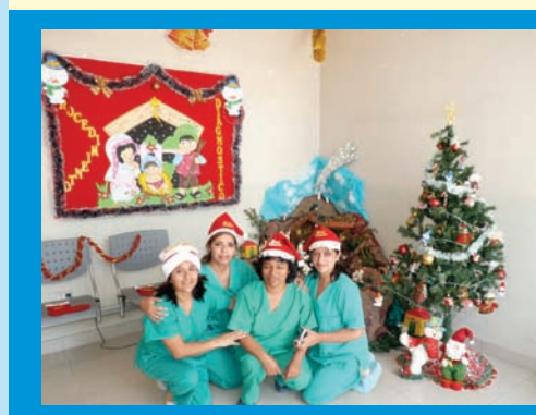
El servicio de procedimientos diagnósticos obtuvo una mención honrosa, en el concurso de ambientes navideños que realizó IREN-Norte