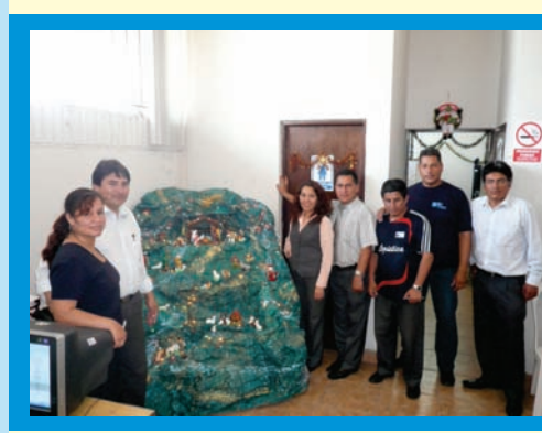
El equipo que conforma la Unidad de Logística muestran orgullosos su nacimiento en el concurso de ambientes navideños