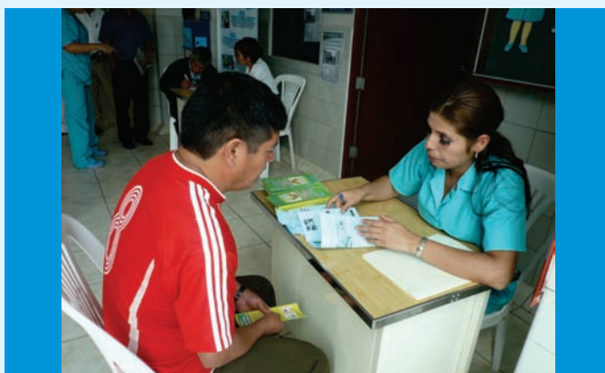
Personal de enfermería brindando consejería preventiva a público asistente a la campaña de despistaje de cáncer de próstata, realizada por el IREN Norte.