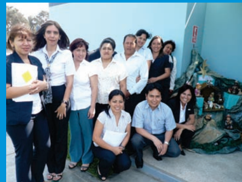
El personal que labora en el Módulo Administrativo II, muestra feliz y orgulloso su nacimiento navideño