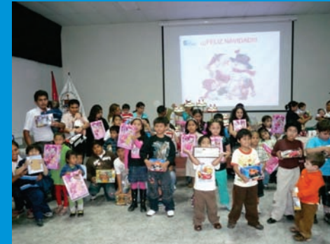
Los hijos del personal que labora en el IREN-Norte, recibieron obsequios y regalos de la institución