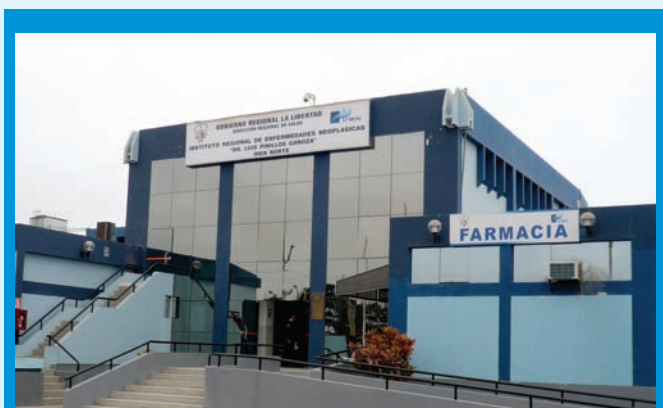
Frontis del Instituto Regional de Enfermedades Neoplásicas "Dr. Luis Pinillos Ganoza"- IREN NORTE

El Instituto Regional de Enfermedades Neoplásicas "Dr. Luis Pinillos Ganoza" – IREN NORTE, se establece en el marco de la descentralización de los servicios médicos oncológicos, y se crea como Unidad Ejecutora N° 410 el 10 de diciembre del 2007, siendo su ámbito de intervención los departamentos del Nor Oriente del país: Tumbes, Piura, Lambayeque, La Libertad, Ancash, San Martín, Cajamarca y Amazonas; para brindar tratamiento especializado de las enfermedades neoplásicas, así como desarrollar acciones de promoción de la salud y prevención de cáncer.