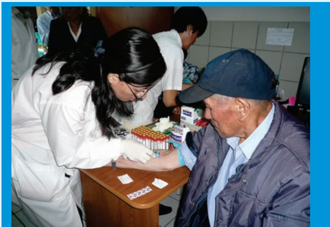
Extrayendo sangre a paciente para análisis de PSA (Antígeno Prostático Específico) durante la campaña gratuita de despistaje de cáncer de próstata, realizada el 18 de Diciembre del 2010

El Instituto Regional de Enfermedades Neoplásicas “Dr. Luis Pinillos Ganoza” – IREN Norte, entidad encargada de brindar servicios oncológicos a la Macro Región Nor Oriente del país, en el marco de su III aniversario institucional realizó la campaña de despistaje de cáncer de próstata a varones mayores de 50 años.