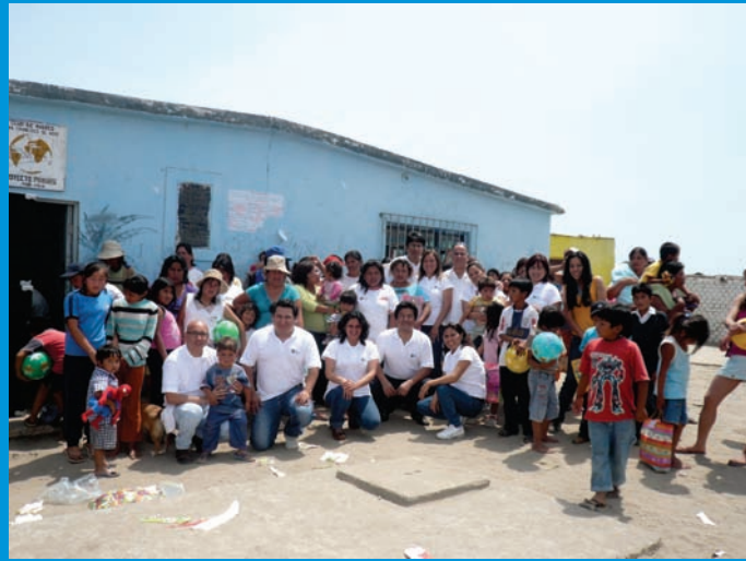
El personal que labora en el Instituto Regional de Enfermedades Neoplásicas junto a sus ahijados y familiares del comedor Torres de San Borja en alto Moche.