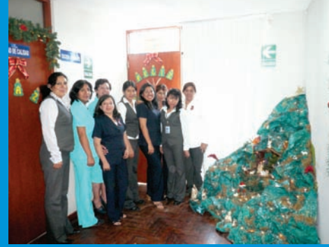
El módulo de salud colectiva y OCI, posando para la foto del recuerdo en el concurso de ambientes navideños