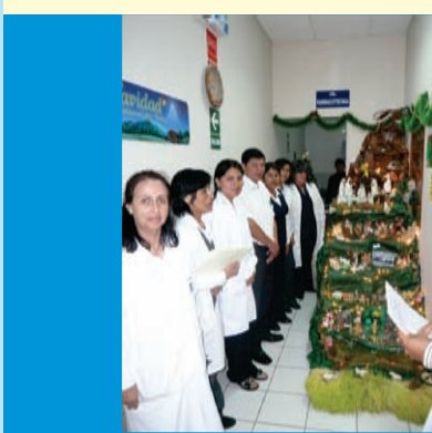
El servicio de farmacia obtuvo el primer lugar, mostrándose felices por la distinción y el logro obtenido