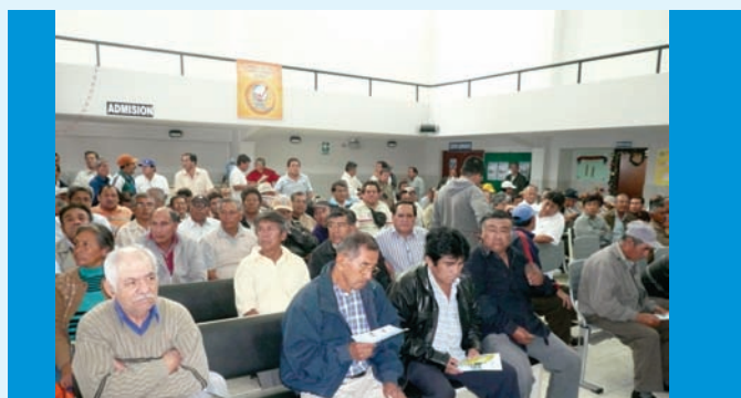
Masiva asistencia de público masculino que participó de la campaña gratuita de despistaje de cáncer de próstata

IREN NORTE realizó Campaña Gratuita de Despistaje de Cáncer de Próstata en el marco de su III Aniversario Institucional, con la finalidad de descartar o detectar precozmente el cáncer.