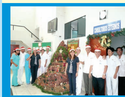
El servicio de consultorios externos obtuvo el segundo lugar en el Concurso de Ambientes Navideños