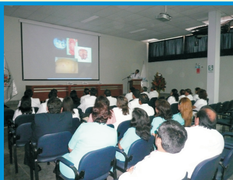
Los integrantes del Cuerpo Médico del IREN Norte realizaron exposiciones de cada especialidad oncológica a la que atienden, dirigida a los asistentes a la Ceremonia de Aniversario