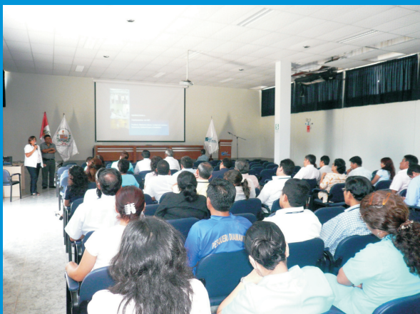
Personal del IREN Norte asistente a la Conferencia Educativa: “Manejo Clínico del Dengue Hemorrágico”.

La Conferencia : “Manejo Clínico del Dengue Hemorrágico” estuvo dirigida al personal del IREN Norte, con la finalidad de incrementar sus conocimientos acerca de la prevención de esta enfermedad.