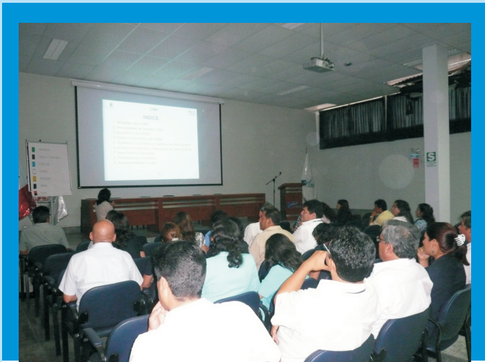
El IREN Norte es el primer Instituto de Salud que obtiene el PAMA, un estudio y tratamiento de purificación que inspecciona residuos sólidos, orgánicos, entre otros.

El Instituto Regional de Enfermedades Neoplásicas “Dr. Luis Pinillos Ganoza” – IREN Norte brindó capacitación al personal administrativo, en lo que respecta al Programa de Adecuación y Manejo Ambiental -PAMA.