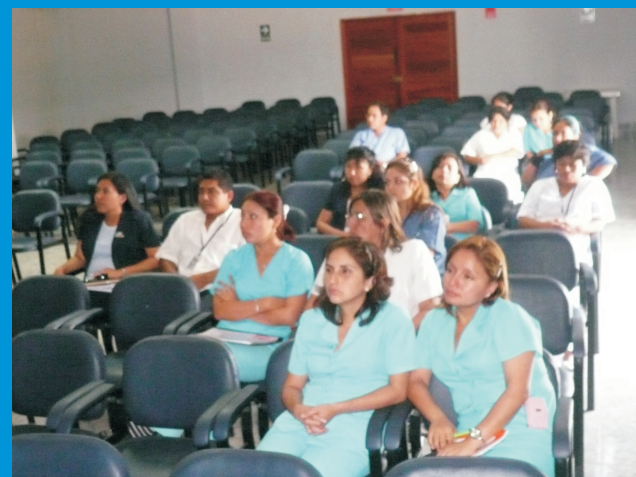
Personal administrativo y asistencial estuvieron presentes durante el desarrollo de la Capacitación de adquisiciones de bienes y servicios del Estado

La participación del personal fue importante para además aclararles otros puntos, como el informarles las fechas hasta las que se deben presentar los requerimientos, teniendo un plazo límite del 15 de cada mes. Con esto se espera tener solicitudes más ordenadas y mejor especificadas para evitar inconvenientes con los requerimientos.