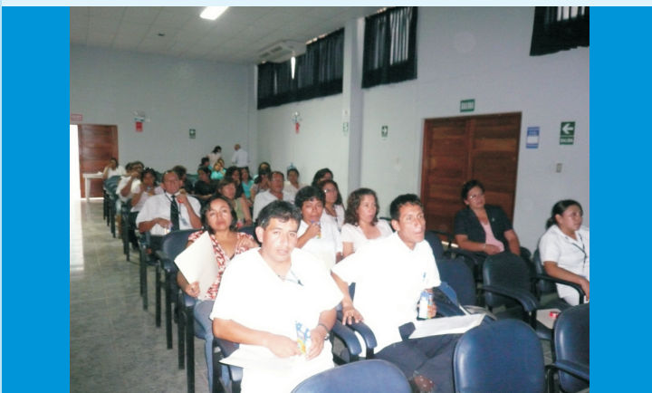
Trabajadores administrativos, técnico asistenciales y de mantenimiento atentos ante las exposiciones desarrolladas en el Taller de Primeros Auxilios en el Auditorio del IREN Norte

El personal estuvo satisfecho con la capacitación, mostrando gran participación, por lo que todos quedaron aptos para brindar primeros auxilios ante cualquier accidente de trabajo.