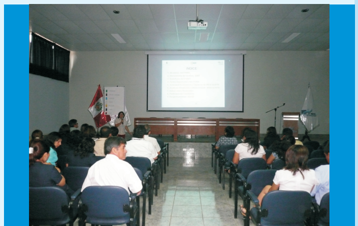
Participantes en la Capacitación “PAMA y Residuos Sólidos”, dirigido al personal de la institución oncológica, realizado en el Auditorio del IREN Norte

Por otro lado, se capacitó al personal en lo que respecta al desecho de residuos sólidos, para lo cual se han instalado tachos de basura indicando los nombres de los desechos a concentrar, de acuerdo a su clasificación para concientizar el hábito de reciclar adecuadamente, con lo cual evitaremos la contaminación ambiental.