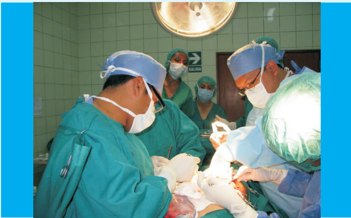
La reconstrucción mamaria es considerada ya una parte importante del tratamiento del cáncer de mama