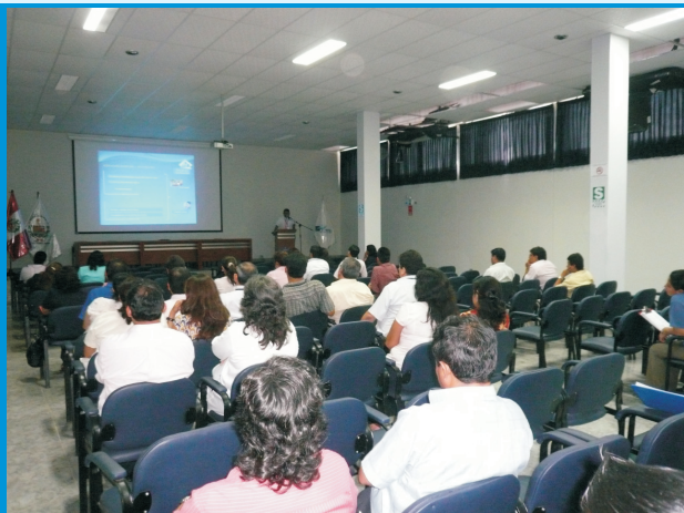
La capacitación en adquisición de bienes y servicios del Estado se realizó en el Auditorio del IREN Norte y contó con la participación de los trabajadores del área administrativa y asistencial

La Dirección de Administración del Instituto Regional de Enfermedades Neoplásicas “Dr. Luis Pinillos Ganoza” - IREN Norte, a través de la Unidad de Logística, realizó Capacitación al personal de los servicios asistenciales y oficinas administrativas de la institución oncológica, con la finalidad de concientizarlos a realizar el llenado correcto del formato de requerimientos de los bienes y servicios del Estado para que no haya inconvenientes al momento de verificar lo solicitado.