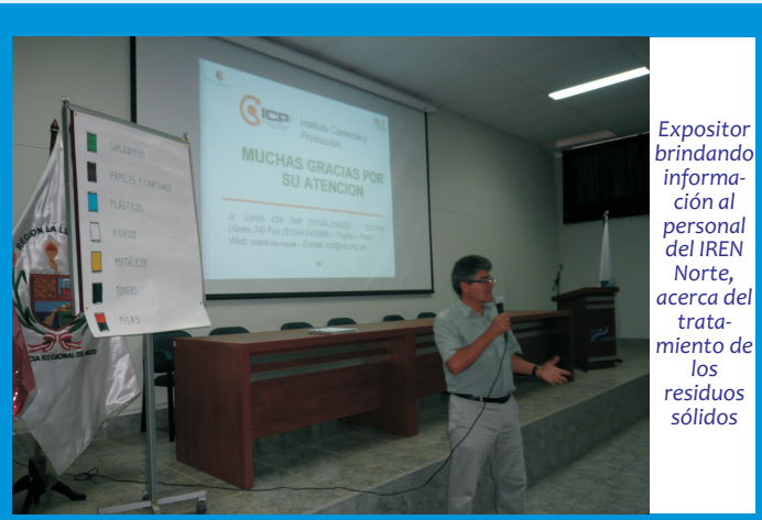
Expositor brindando información al personal del IREN Norte, acerca del tratamiento de los residuos sólidos

El IREN Norte es el primer Instituto de Salud que obtiene el PAMA, un estudio y tratamiento de purificación que inspecciona residuos sólidos, orgánicos, entre otros.