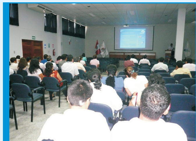
Las exposiciones de la Capacitación en adquisiciones de bienes y servicios del Estado estuvieron a cargo del personal de la Unidad de Logística del IREN Norte

La capacitación se realizó en dos días, teniendo como expositores al personal de Logística quienes sustentaron la manera idónea de realizar las solicitudes para la adquisición de bienes y servicios.