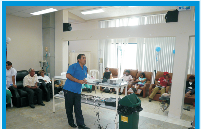
Charlas Educativas dirigidas a los pacientes y familiares que son atendidos en el Servicio de Quimioterapia del IREN Norte

Cabe indicar que durante el presente año continuarán las charlas educativas a cargo del Servicio de Quimioterapia.