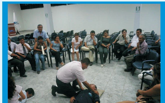
Personal de mantenimiento durante la práctica de primeros auxilios.