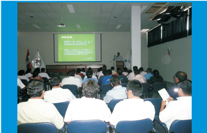
El personal del IREN Norte participando del Taller de Primeros Auxilios realizado en el Auditorio Institucional, con el objetivo de brindar información a los trabajadores ante cualquier accidente de trabajo

El Instituto Regional de Enfermedades Neoplásicas “Dr. Luis Pinillos Ganoza” - IREN Norte, organizó un Taller de Capacitación en Primeros Auxilios al personal, considerando que las emergencias pueden suscitarse en cualquier momento, dentro y fuera de nuestro entorno laboral, por lo que todos deben estar preparados para prestar y actuar dando Primeros Auxilios y salvar vidas.