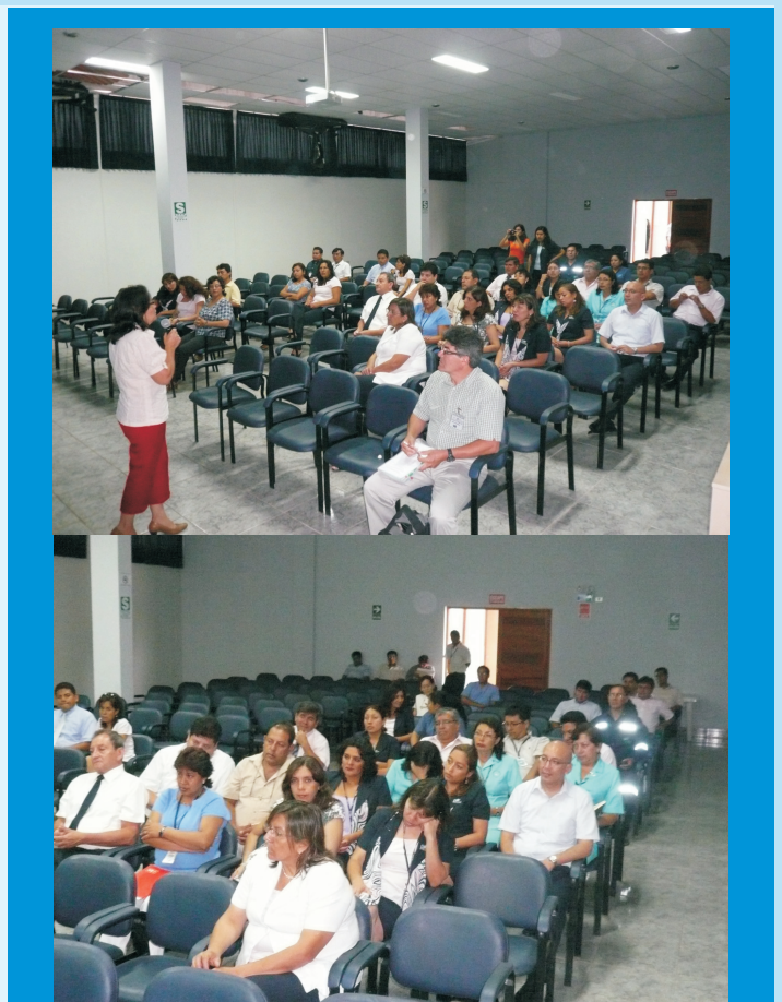
Masiva concurrencia del personal para la capacitación del Programa de Adecuación Medio Ambiental y residuos sólidos

Por otro lado, se capacitó al personal en lo que respecta al desecho de residuos sólidos, para lo cual se han instalado tachos de basura indicando los nombres de los desechos a concentrar, de acuerdo a su clasificación para concientizar el hábito de reciclar adecuadamente, con lo cual evitaremos la contaminación ambiental.