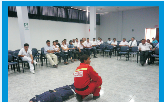
Bombero Voluntario de la Brigada de Bomberos N° 26 de Trujillo, durante la práctica del Taller de Primeros Auxilios dirigida al personal del IREN Norte

El IREN NORTE realizó un Taller de Capacitación en Primeros Auxilios, dirigido al personal administrativo, Técnico Asistencial y de Mantenimiento, con la finalidad de que puedan actuar de forma inmediata ante cualquier accidente laboral