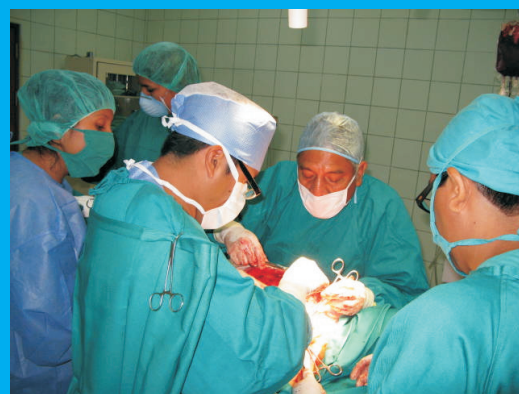
La reconstrucción de la mama puede realizarse de forma inmediata tras la cirugía (en un mismo acto operatorio) o pasado un tiempo, meses o años después

La reconstrucción de la mama puede realizarse de forma inmediata tras la cirugía (en un mismo acto operatorio) o pasado un tiempo, meses o años después. Esto se debe coordinar entre el mastólogo oncólogo, cirujano plástico, y la paciente a quien se le debe brindar información clara y precisa sobre las opciones de reconstrucción, ventajas y desventajas de cada método. La decisión final de optar por la reconstrucción mamaria o no, debe ser absolutamente personal de la paciente.