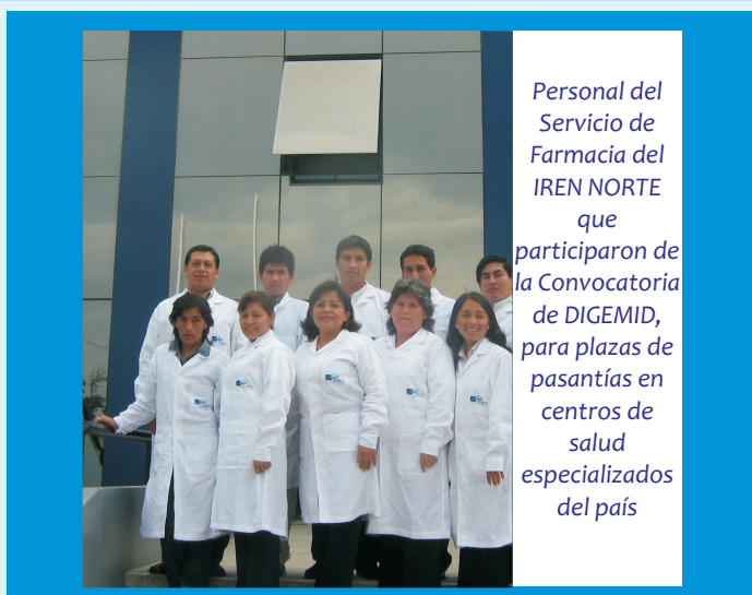
Personal del Servicio de Farmacia del IREN NORTE que participaron de la Convocatoria de DIGEMID, para plazas de pasantías en centros de salud especializados del país