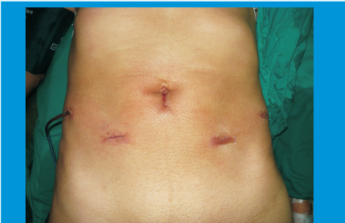
La cirugía laparoscópica tiene como ventajas la rápida recuperación del paciente para su pronta reinsertión a sus actividades habituales

La Laparoscopia se está desarrollando a través de una sola incisión y/o a través de orificios naturales, como el ombligo, la vagina (nefrectomía, colecistectomía, etc.); el estómago (apéndice, etc.)