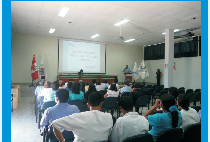
Público en general, personal administrativo y asistencial estuvieron presentes durante el desarrollo de la Inauguración de las Charlas Educativas IREN NORTE 2010

Cabe destacar que las Charlas Preventivas serán dictadas por nuestros especialistas en oncología y se desarrollarán todos los viernes a las 12:00 m. en el Auditorio del IREN Norte, ubicado en la Carretera Panamericana Norte Km. 558 - Moche (Cerca al Óvalo La Marina). Asimismo, se entregará certificados de capacitación a quienes hayan participado de dichas conferencias.