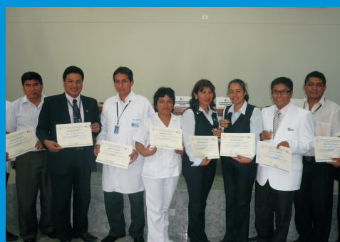
Los "SERES DE CALIDAD" 2010 del IREN Norte, el reconocimiento por su trabajo eficiente y responsable en nuestra Institución