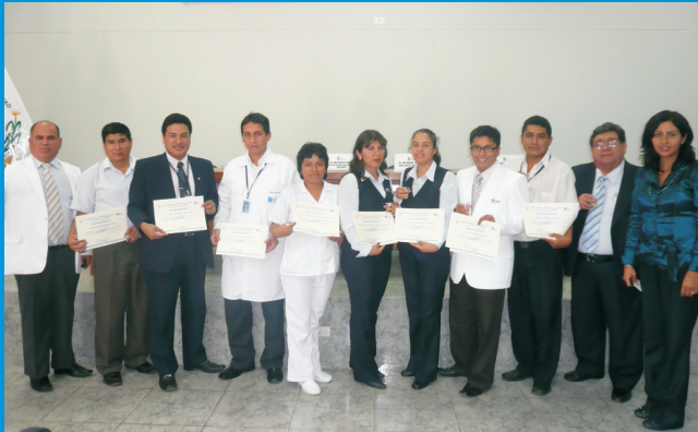
Los trabajadores del IREN NORTE que fueron elegidos como SERES DE CALIDAD 2010, acompañados de funcionarios de la Institución

El Instituto Regional de Enfermedades Neoplásicas “Dr. Luis Pinillos Ganoza” – IREN Norte, en el marco de la celebración del Día del Trabajo, implementó desde este año la estrategia “SERES DE CALIDAD” con la finalidad de institucionalizar este reconocimiento anualmente que será otorgado a los trabajadores que han destacado en el cumplimiento de sus labores asistenciales y administrativas.