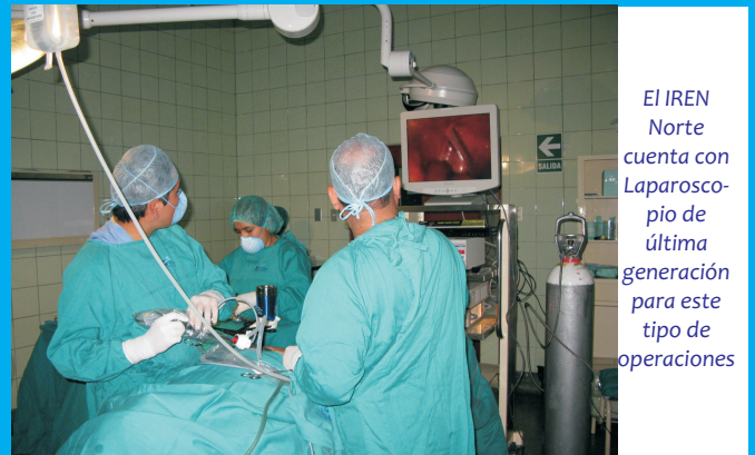
El IREN Norte cuenta con Laparoscopia de última generación para este tipo de operaciones