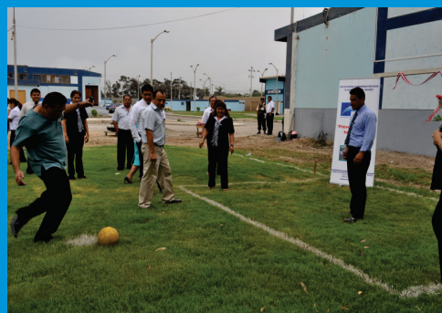
Personal del IREN Norte, disfrutando del nuevo recinto deportivo de la institución