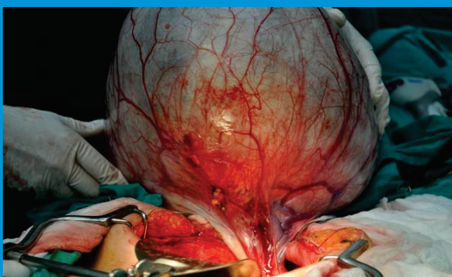
Gigantesco tumor de ovario de 12 kg. y 55 cm. de diámetro extraído a una paciente de IREN Norte