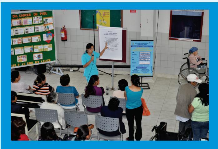
Personal de Enfermería brindando charla informativa a los pacientes que se encuentran en la sala de espera de consultorios externos

El Departamento de Enfermería de IREN Norte brinda charlas diarias a los pacientes en temas relacionados a la adopción de estilos de vida saludables y cuidados a los pacientes oncológicos