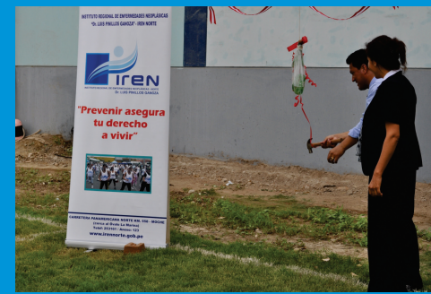
Instantes e que se da por inaugurado el campo deportivo del IREN Norte para beneficio de los trabajadores de IREN Norte