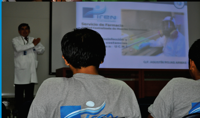
Personal de Limpieza de IREN Norte, durante el Curso - Taller de Higiene y Desinfección, organizado por el Servicio de Epidemiología del Departamento de Control del Cáncer.

hospitalarias, así como la desinfección de los ambientes hospitalarios. El Curso - Taller estuvo a cargo de profesionales capacitados de las diferentes áreas asistenciales de la institución oncológica.