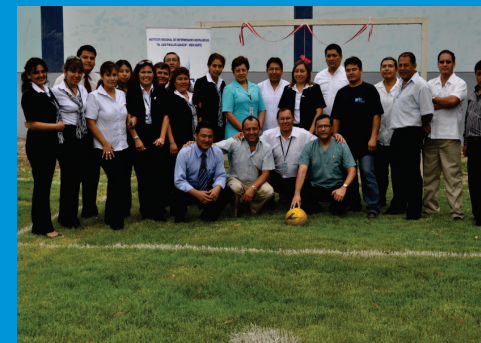
Personal de IREN Norte, felices por el nuevo campo deportivo del IREN-Norte