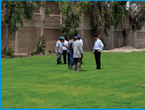
Personal de IREN Norte, revisando el campo deportivo previo a su inauguración