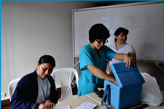
Personal del Centro de Salud de Moche, apoyando la Campaña de Vacunación a los trabajadores del IREN Norte

El Instituto Regional de Enfermedades Neoplásicas-IREN Norte, velando por la salud de sus trabajadores programó la Campaña de Vacunación de Hepatitis B y Tétanos con la finalidad de que el personal que aún no cuenta con estas vacunas puedan estar protegidos ante cualquier posible enfermedad.