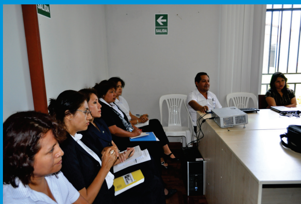
Personal administrativo y asistencial durante la Reunión Técnica del Seguro Integral de Salud - SIS

El Instituto Regional de Enfermedades Neoplásicas “Dr. Luis Pinillos Ganoza” – IREN Norte, ha implementado desde enero del presente año el Seguro Integral de Salud - SIS, con la finalidad de brindar atención a personas con diagnóstico de cáncer que no cuentan con un seguro de salud, priorizando en aquellas personas vulnerables que se encuentran en situación de pobreza extrema.