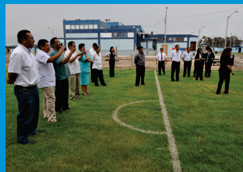
Personal de IREN Norte presente durante la inauguración del campo deportivo, escenario de futuros encuentros deportivos institucionales para promover la actividad física