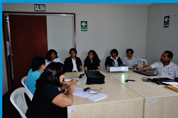
Reunión Técnica para el análisis de los procesos administrativos para la atención del SIS

Es ese sentido el IREN Norte se encuentra capacitando al personal administrativo y asistencial para la ejecución eficaz de la atención a través de este servicio especializado oncológico.