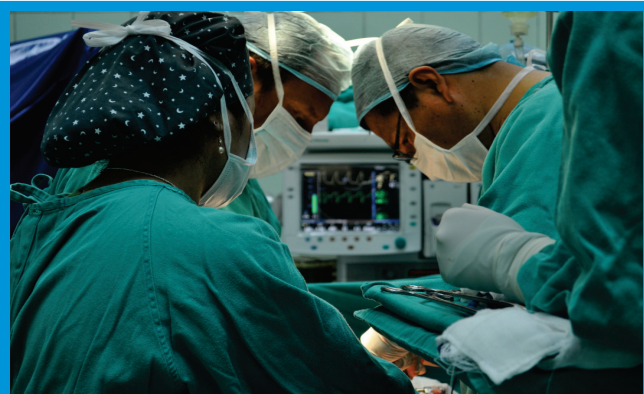
Médicos Ginecólogos Oncólogos realizando la cirugía de tumor de ovario en la sala de operaciones del IREN Norte