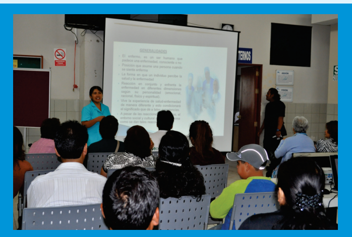
Diversos temas que orientan a la adopción de estilos de vida saludables y al cuidado de los pacientes oncológicos son tratados por el staff de profesionales del Departamento de Enfermería del IREN Norte