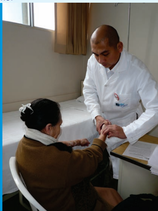
La unidad de Terapia del dolor y cuidados paliativos del IREN Norte, ganó una beca de la organización Help the Hospices, siendo la única institución de salud peruana que obtuvo el premio

Cabe resaltar, que IREN Norte es la única institución que ganó en Perú, habiéndose presentado un total de 60 proyectos a nivel latinoamericano. El proyecto será aplicado en la institución oncológica en agosto próximo.