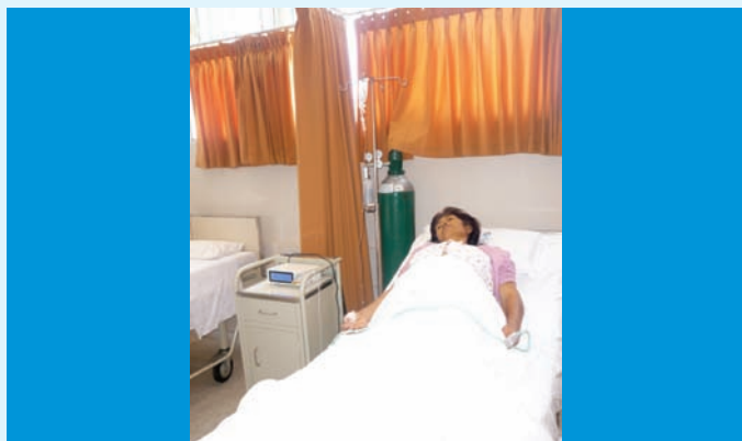
Los cuidados paliativos y el tratamiento del dolor son elementos esenciales para mejorar o mantener la calidad de vida de muchos enfermos afectados por procesos incurables, crónicos o terminales

La organización HELP THE HOSPICES, de Londres, mediante la Asociación Latinoamericana de Cuidados Paliativos, con sede en Buenos Aires - Argentina, realizó una convocatoria de proyectos de aplicación en Cuidados Paliativos en Latinoamérica, otorgando 10 becas para la implementación de las unidades de terapia del dolor y cuidados paliativos de las instituciones ganadoras.