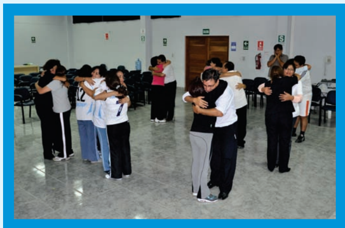
Abrazoterapia es una de las técnicas que redescubre la importancia del abrazo como necesidad vital que tenemos todos de amar y sentirnos amados de verdad.

Mejorar su cultura organizacional incrementando su nivel de motivación y cooperación, asimismo el sentimiento de Identidad con la institución.