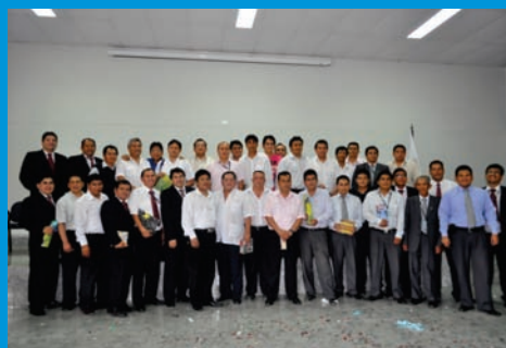
Padres Irenistas, durante la ceremonia por el Día del Padre en el auditorio institucional