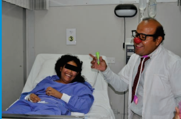
Los pacientes demuestran alegría con la visita de los alumnos del Taller de Claun de la Universidad Privada del Norte

Asimismo, el titular de la institución oncológica manifestó su beneplácito para con este tipo de actividades que ayudan a la mejoría de los enfermos con cáncer, “mientras más acciones positivas haya en sus vidas, incrementan sus ganas de vivir y tolerar los procedimientos a los que son sometidos para mejorar su calidad de vida”.