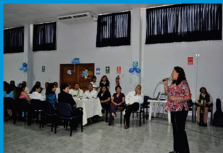
Interpretación de canciones criollas para todos los padres del IREN Norte.