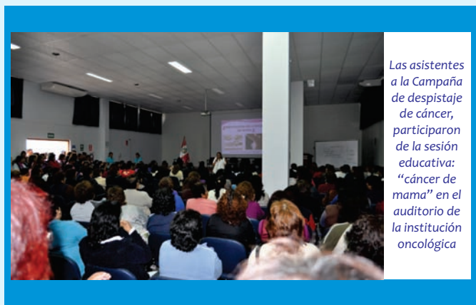
Las asistentes a la Campaña de despistaje de cáncer, participaron de la sesión educativa: "cáncer de mama" en el auditorio de la institución oncológica

Cabe recalcar que la campaña fue un éxito debido a que se benefició a 300 mujeres provenientes de los diversos distritos de Trujillo y provincias de la región La Libertad. A las pacientes que se les detectó anomalías en las mamas y no contaban con seguro social, se les derivó al Hospital La Noria para realizarles la mamografía de manera gratuita.