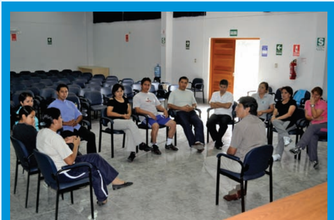
Personal administrativo y asistencial del IREN Norte, participando del Taller de Clima Organizacional.