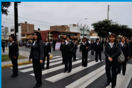
Personal femenino de las áreas administrativas y asistenciales del IREN Norte