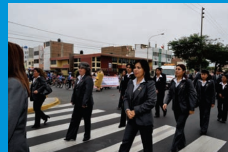
Batallón de mujeres del IREN Norte en el desfile por Fiestas Patrias 2011