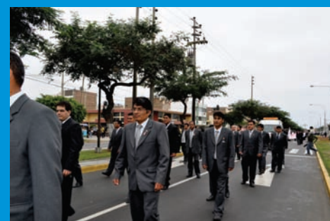
Batallón de varones del IREN Norte en el desfile por el aniversario patrio