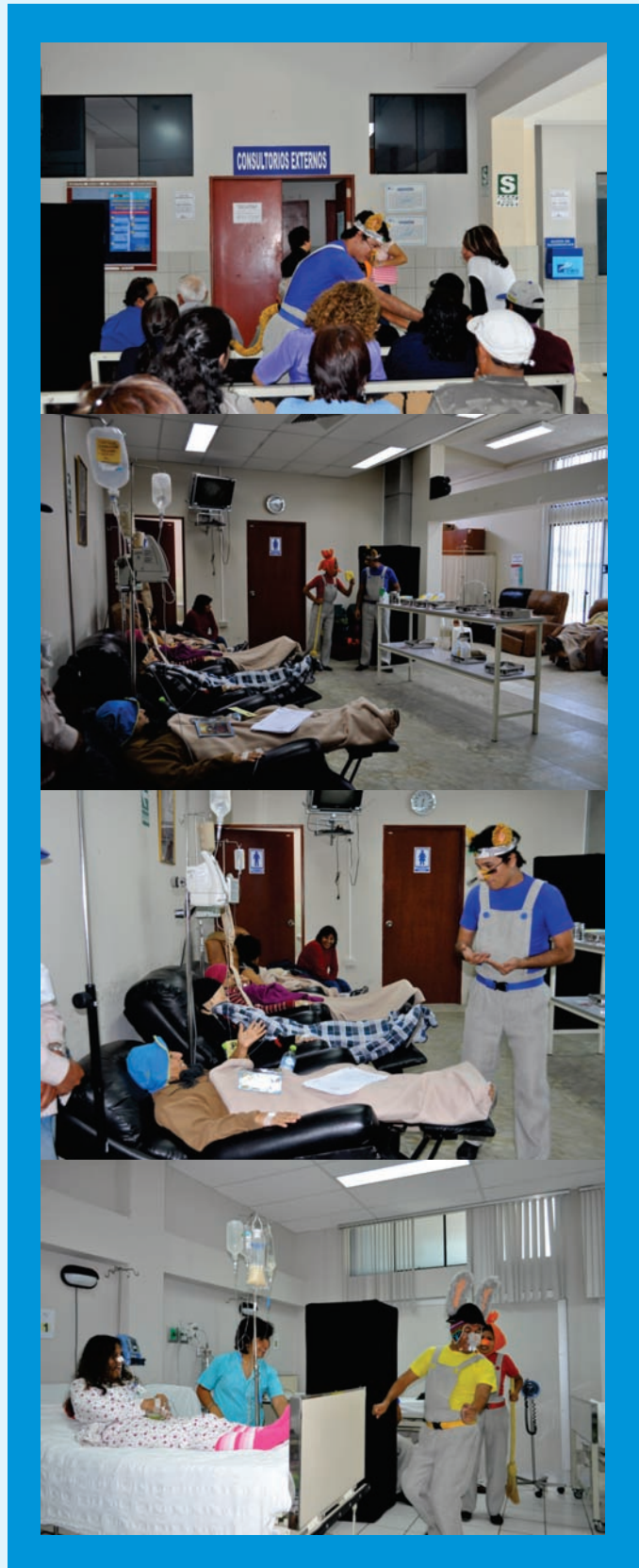
Los pacientes de los servicios de consultorios externos, quimioterapia y hospitalización recibieron con gran alegría a los integrantes del grupo de teatro