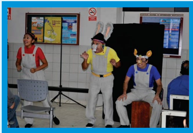
Grupo de Teatro: “Un, dos, tres”, departió gratos momentos de alegría con los pacientes del IREN Norte

Los pacientes de los servicios de Consultorios Externos, Quimioterapia y Hospitalización del Instituto Regional de Enfermedades Neoplásicas - IREN Norte recibieron con gran algarabía a los integrantes del grupo de teatro “un, dos, tres” que desinteresadamente les hicieron una exhibición de títeres para alegrar los corazones de los pacientes y sus familiares.