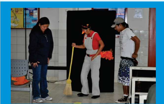
Haciendo participar a los familiares para alegría de los pacientes.

Asimismo, escenificaron un cuento que logró arrancarles una sonrisa a los pacientes, quienes mostraron gran satisfacción por el hecho de que estos jóvenes los visiten para hacerlos vivir momentos de alegría y aliviar con una sonrisa el mal momento que viven con la enfermedad que padecen.