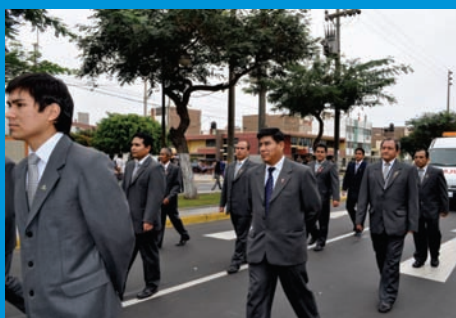
Batallón de varones del IREN Norte en el desfile de Fiestas Patrias 2011