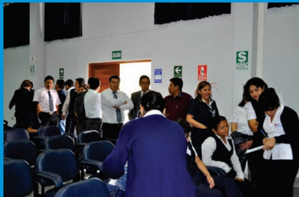
Campaña de Despistaje de presión arterial, colesterol, diabetes y salud bucal para los trabajadores del IREN Norte

El Instituto Regional de Enfermedades Neoplásicas – IREN Norte, a través de la Unidad de Recursos Humanos, realizó la Campaña Médica de Despistaje de presión arterial, colesterol, diabetes y salud bucal, dirigida al personal administrativo, asistencial, mantenimiento y servicios generales de la institución oncológica.