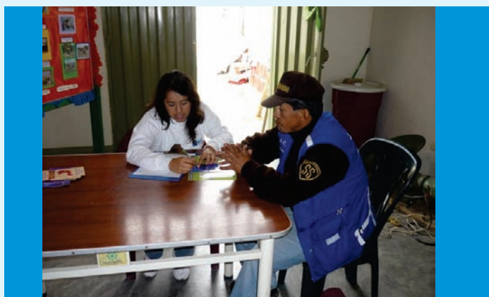
Consejerías preventivas en los distritos de Trujillo, a cargo de personal de enfermería del IREN Norte

El Departamento de Control del Cáncer del Instituto Regional de Enfermedades Neoplásicas - IREN Norte, en coordinación con instituciones públicas y/o privadas realiza Campañas de Consejería Preventiva en cáncer a la población en general.