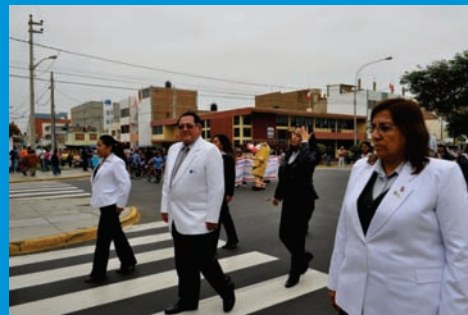
Integrantes del Cuerpo Médico de IREN Norte, en el desfile de Fiestas Patrias