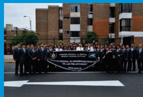
Personal del IREN Norte que participó del Desfile por Fiestas Patrias