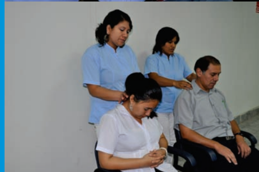
Campaña de Salud para los trabajadores del IREN norte