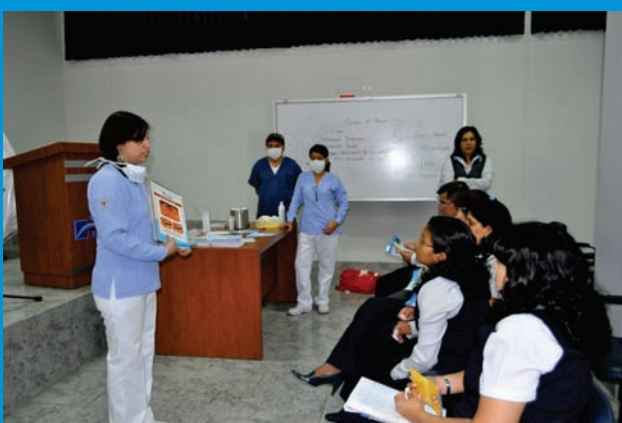
Charla Educativa sobre los cuidados de la salud bucal

Esta campaña se realizó con la finalidad de salvaguardar el bienestar físico y mental de los trabajadores.