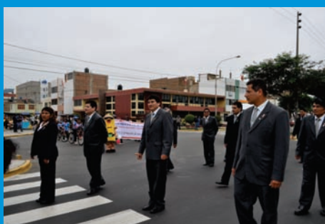
Personal masculino de las áreas administrativas y asistenciales del IREN Norte