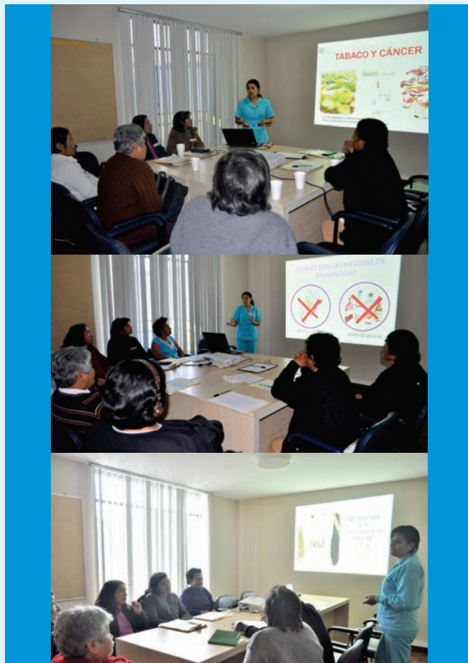
Personal de Enfermería del Servicio de Promoción de la Salud, capacitando a los promotores de salud en diversos temas de prevención del cáncer

Los promotores de salud son personas líderes de su comunidad que se capacitan para promover conductas de autocuidado, educación preventiva-promocional, actividades organizativas y de información necesaria sobre temáticas vinculadas a la salud, convirtiéndose en el nexo entre la comunidad y el equipo de salud, desempeñándose como agentes multiplicadores.