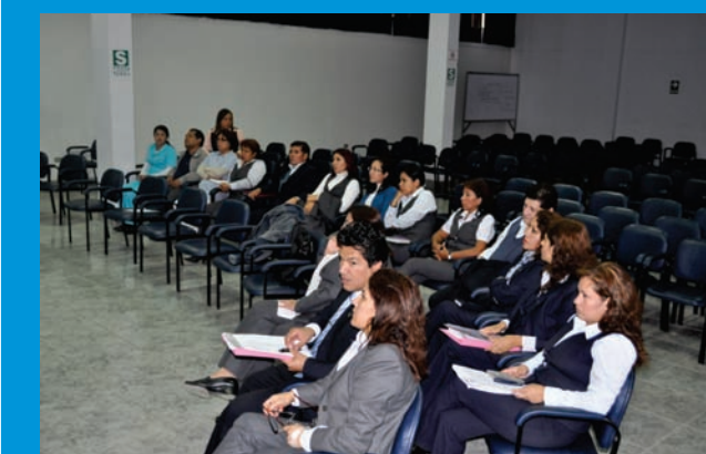
Personal del IREN Norte que participó del Curso Taller: "Psicología integral por análisis transaccional para el manejo del estrés"