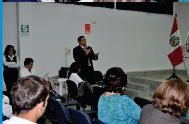
Personal médico del IREN Norte, participando del III Conversatorio Clínico Patológico, realizado en el Auditorio del IREN Norte